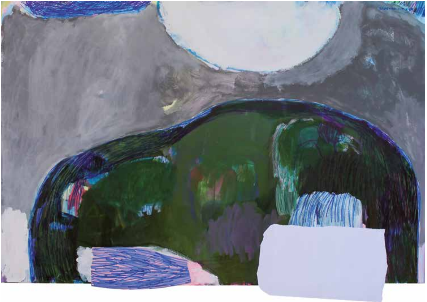
27. Luna, noč (hočem domov), 2020, mešana tehnika na platnu, 106 x 150 cm