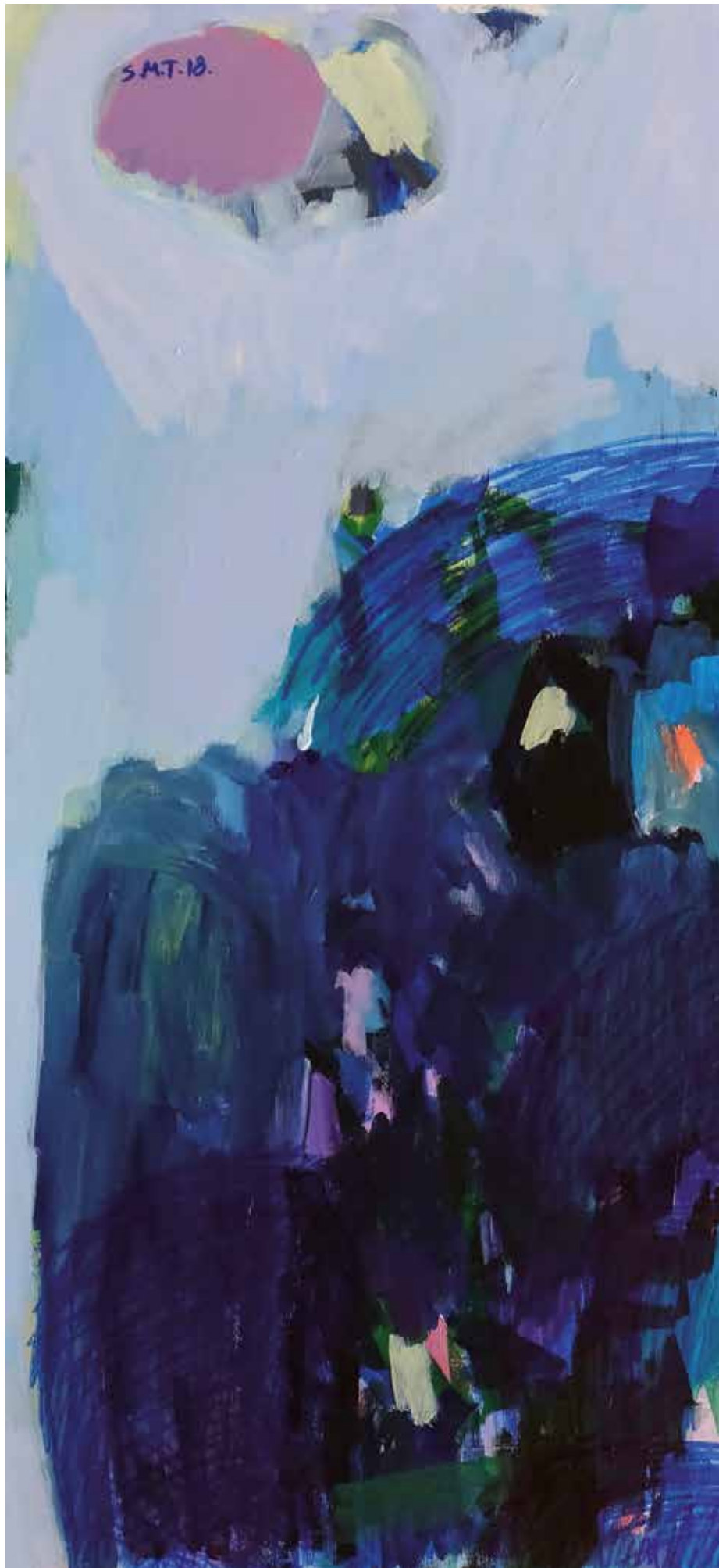
07. Noć (Svitanje), 2018, mešana tehnika na platnu, 80 x 100 cm