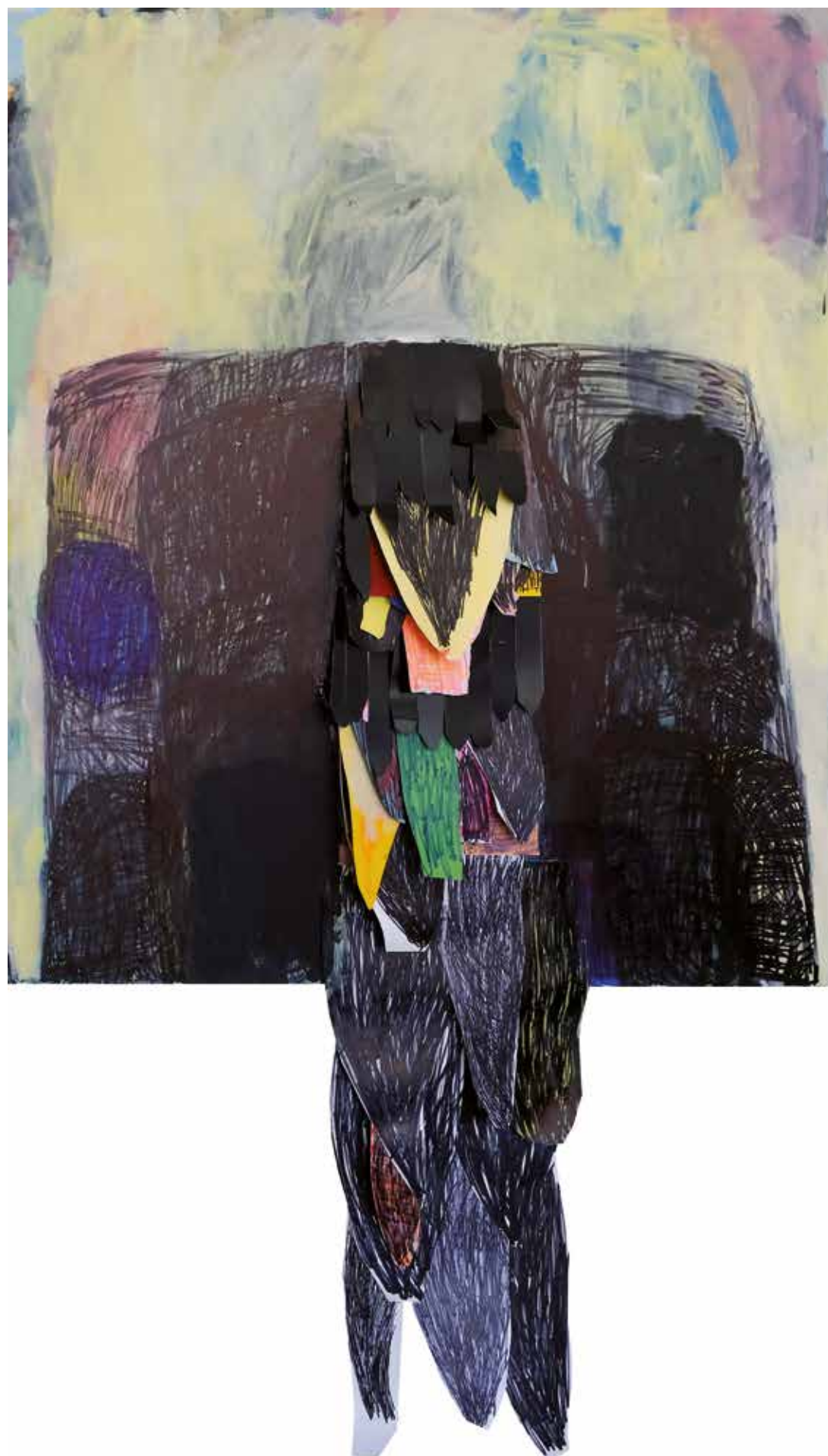
09. Gozdno sonce, 2018, mešana tehnika na platnu, 175 x 100 cm