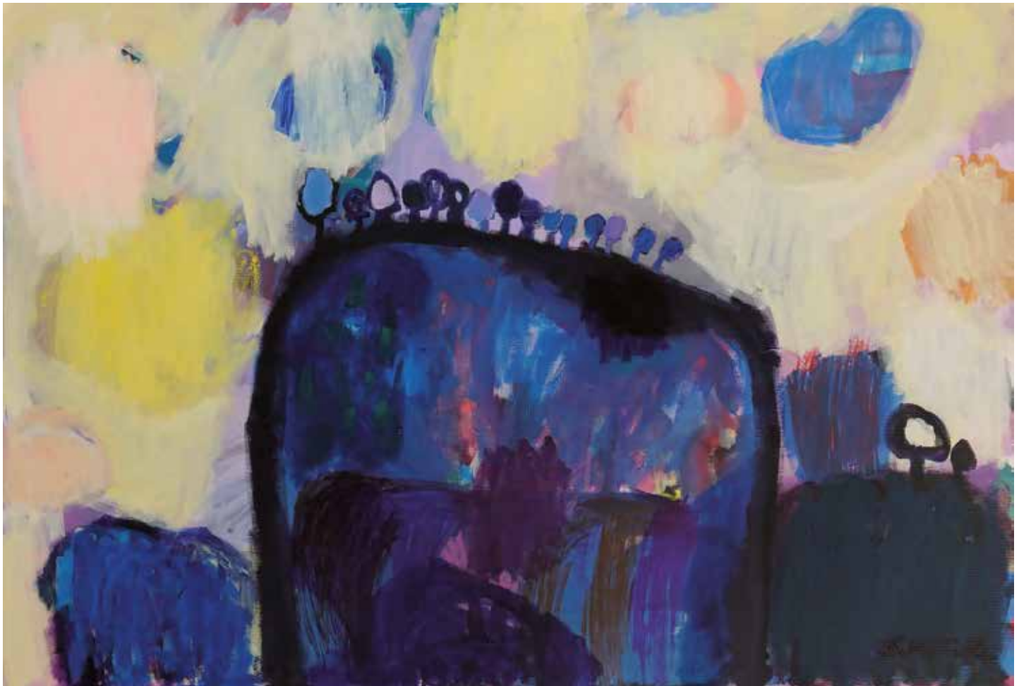
08. Drevesa in sonce, 2018, mešana tehnika na platnu, 80 x 100 cm