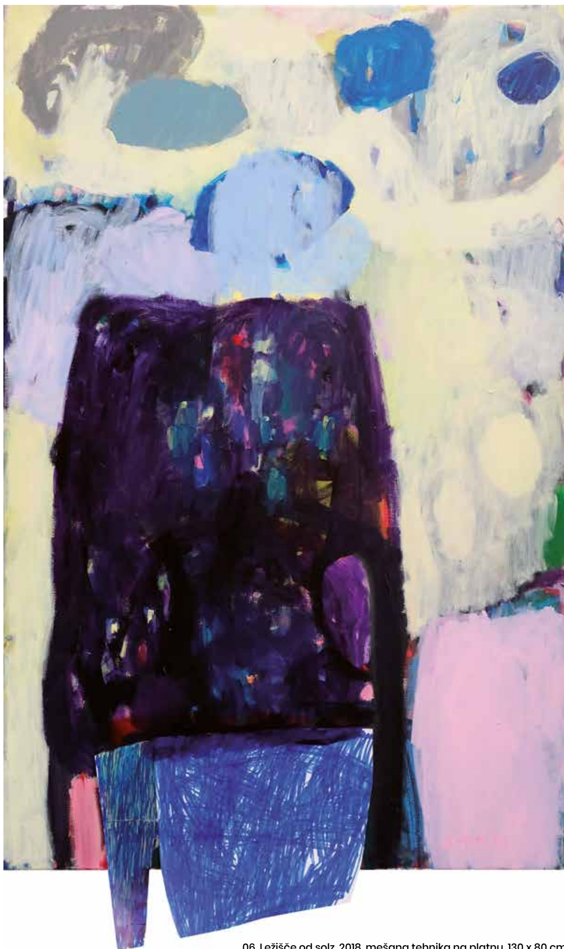
06. Ležišče od solz, 2018, mešana tehnika na platnu, 130 x 80 cm