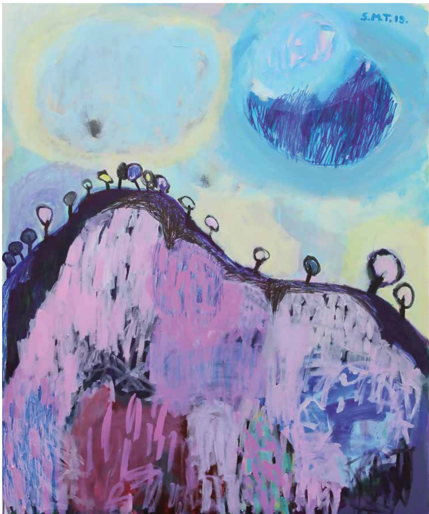
13. Drevesa in rožnata, 2019, mešana tehnika na platnu, 120 x 100 cm