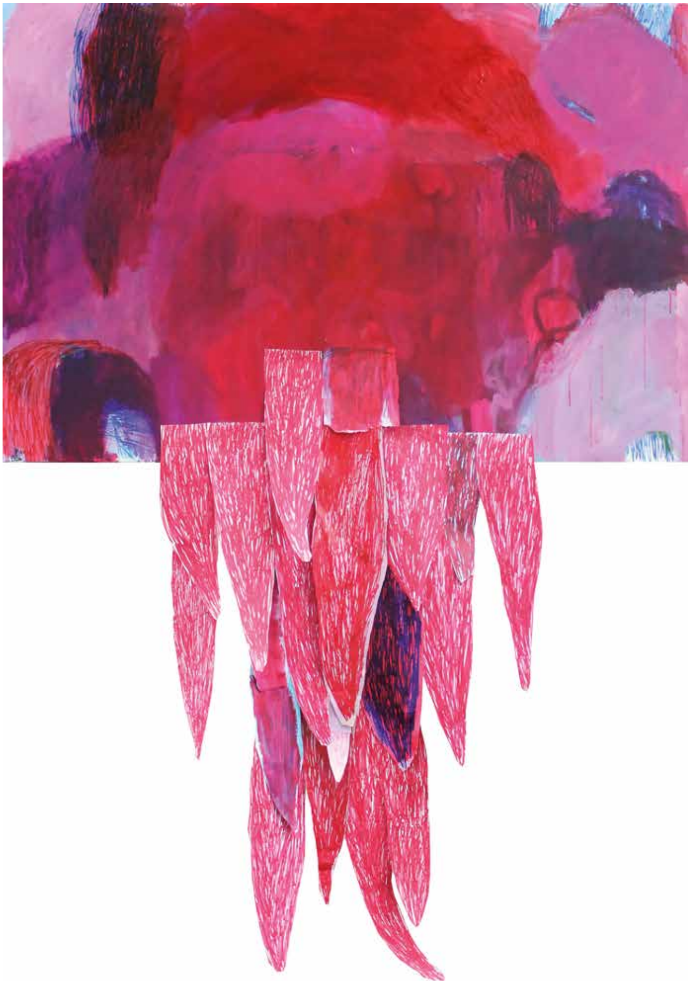
18. Rdeči dež, 2019, mešana tehnika na platnu, 214 x 150 cm, Nagrajenka DLUM'2019