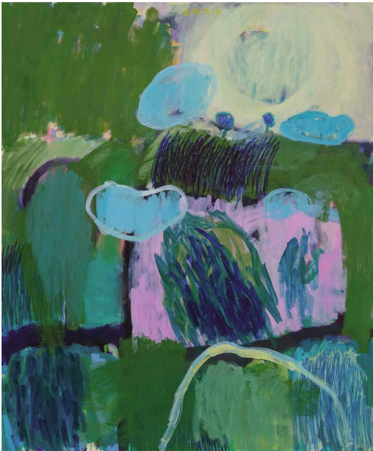
24. Sonce, ogrej me (Bosna), 2019, mešana tehnika na platnu, 120 x 100 cm