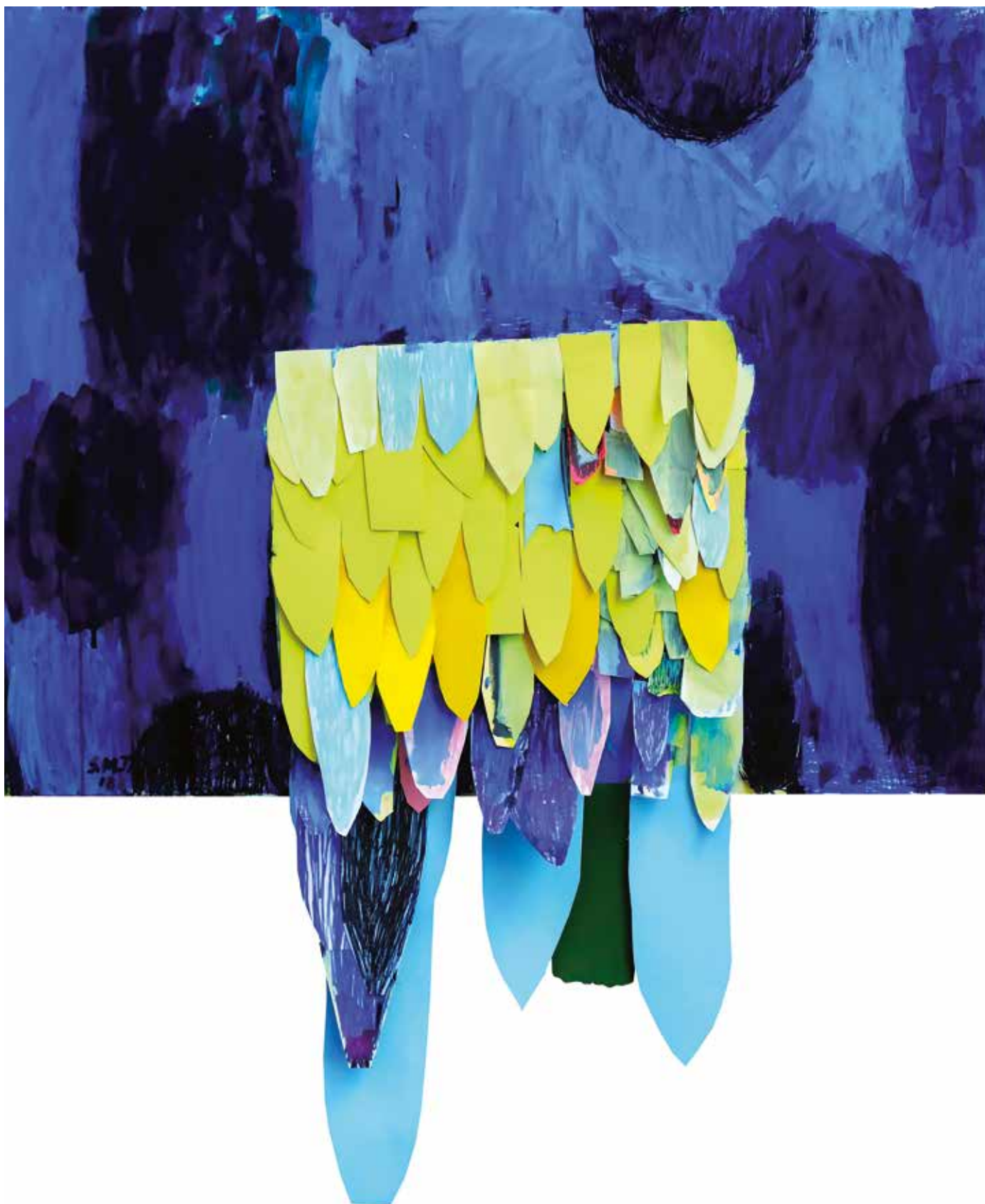
03. Nebo in sonce, 2018, mešana tehnika na platnu, 118 x 100 cm