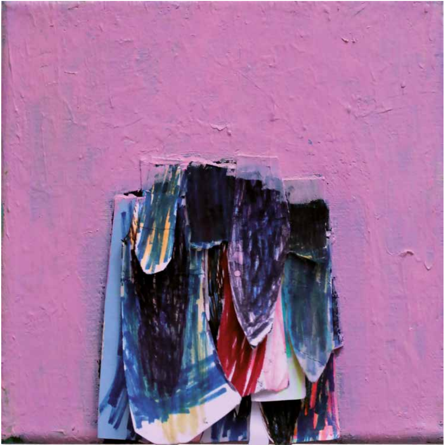
23. Rožnato..., 2019, mešana tehnika na platnu, 15 x 15 cm