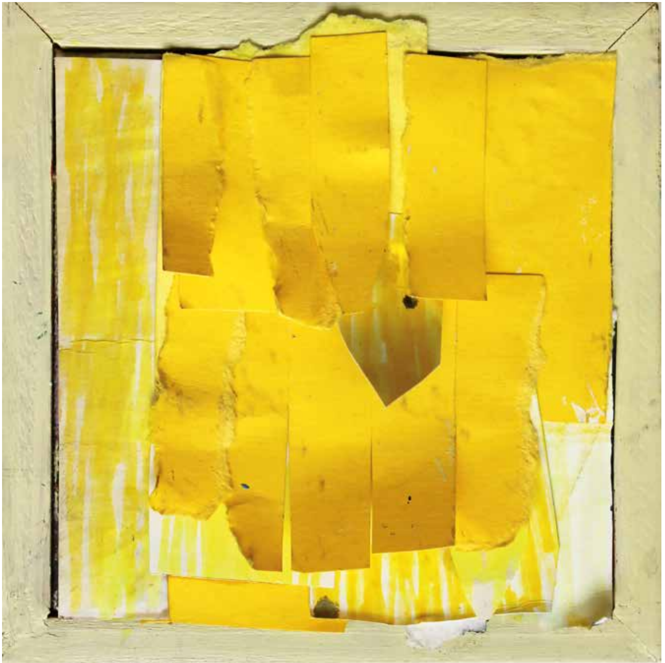
02. Rumeni dež, 2018, mešana tehnika na platnu, 12 x 10 cm