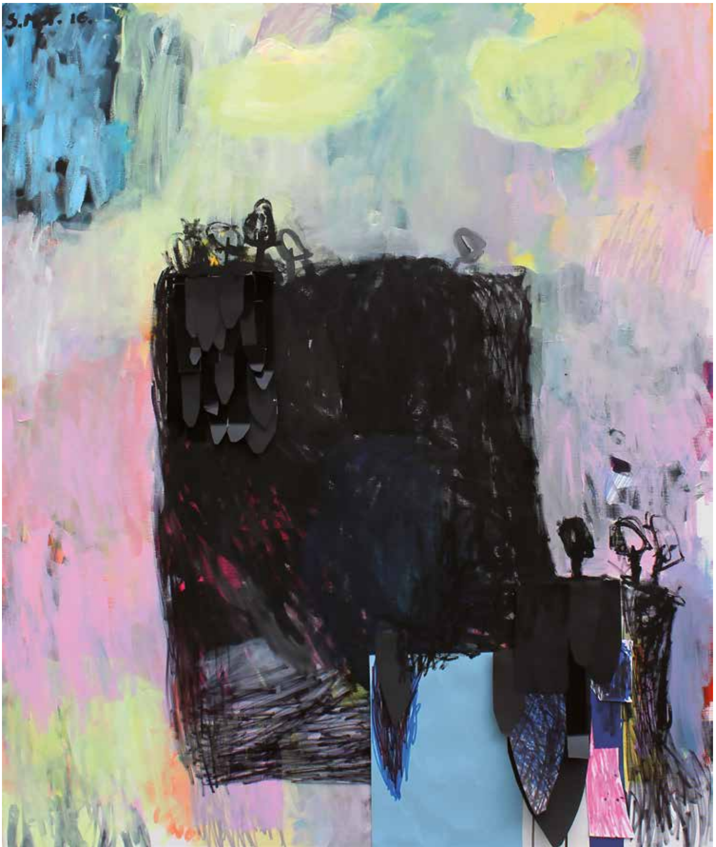
01. Gozdovi (Na robu), 2016, mešana tehnika na platnu, 120 x 100 cm, Nagrajenka DLUM'2016