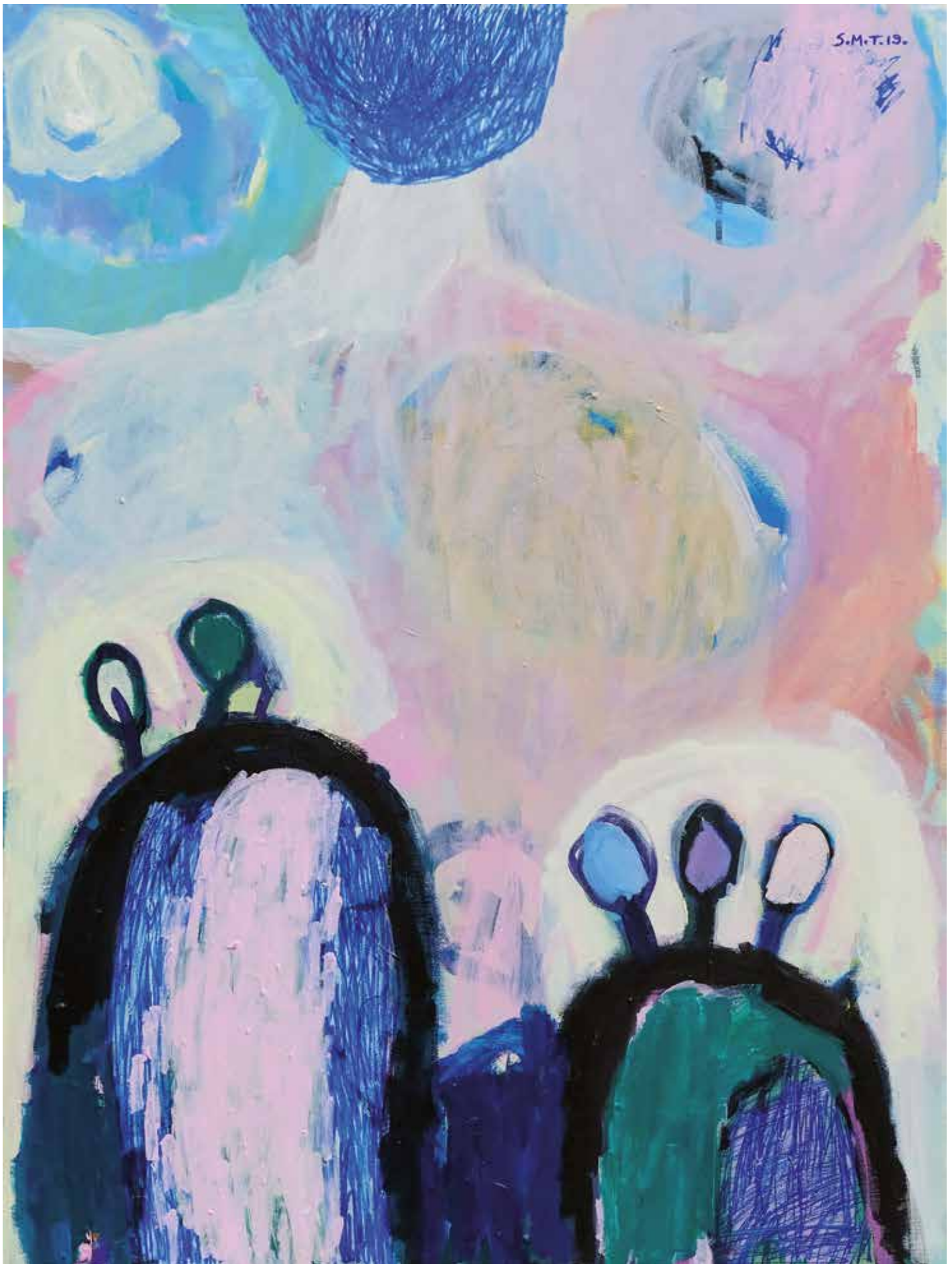
21. Rožnati dež, 2019, mešana tehnika na platnu, 80 x 60 cm