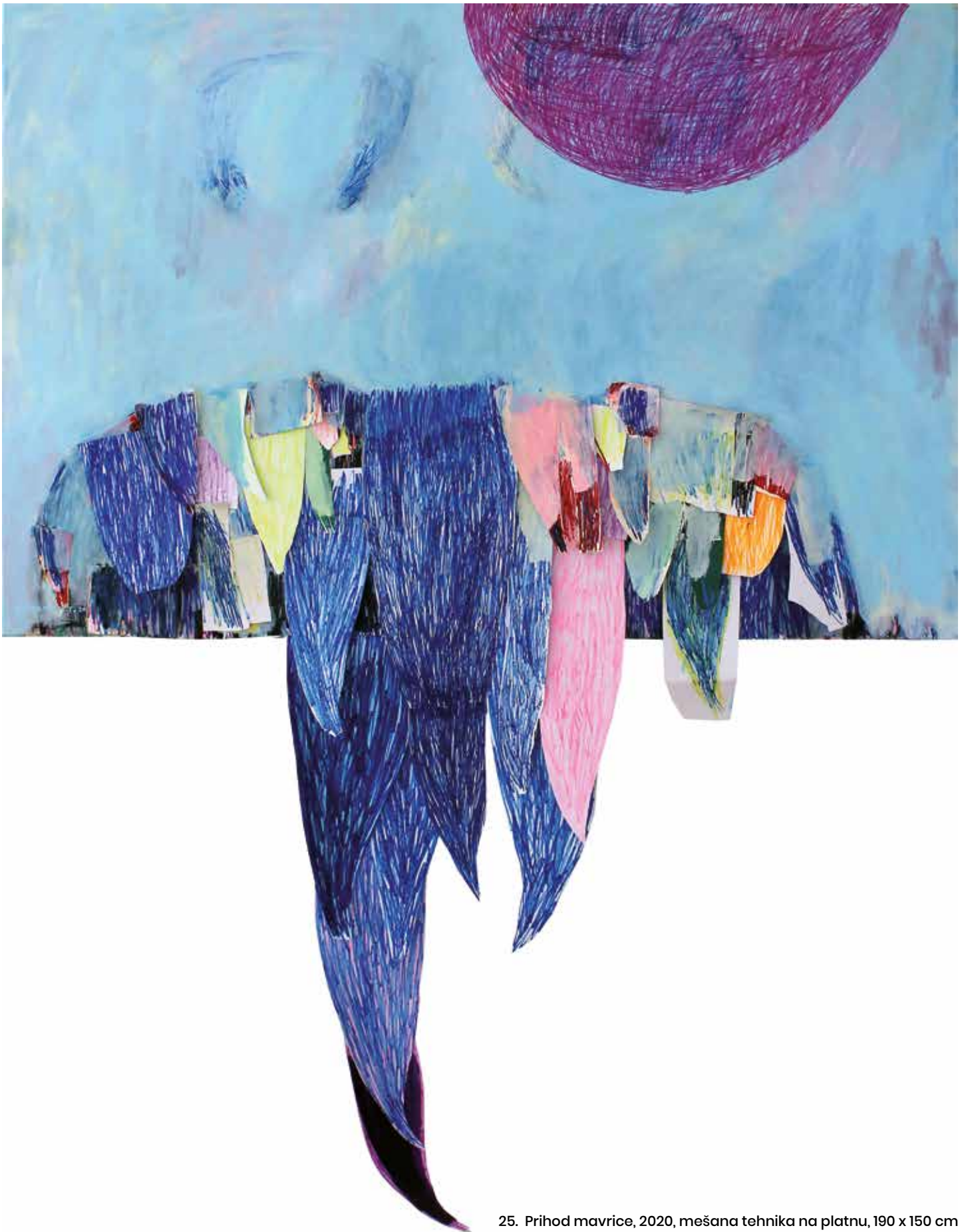
25. Prihod mavrice, 2020, mešana tehnika na platnu, 190 x 150 cm