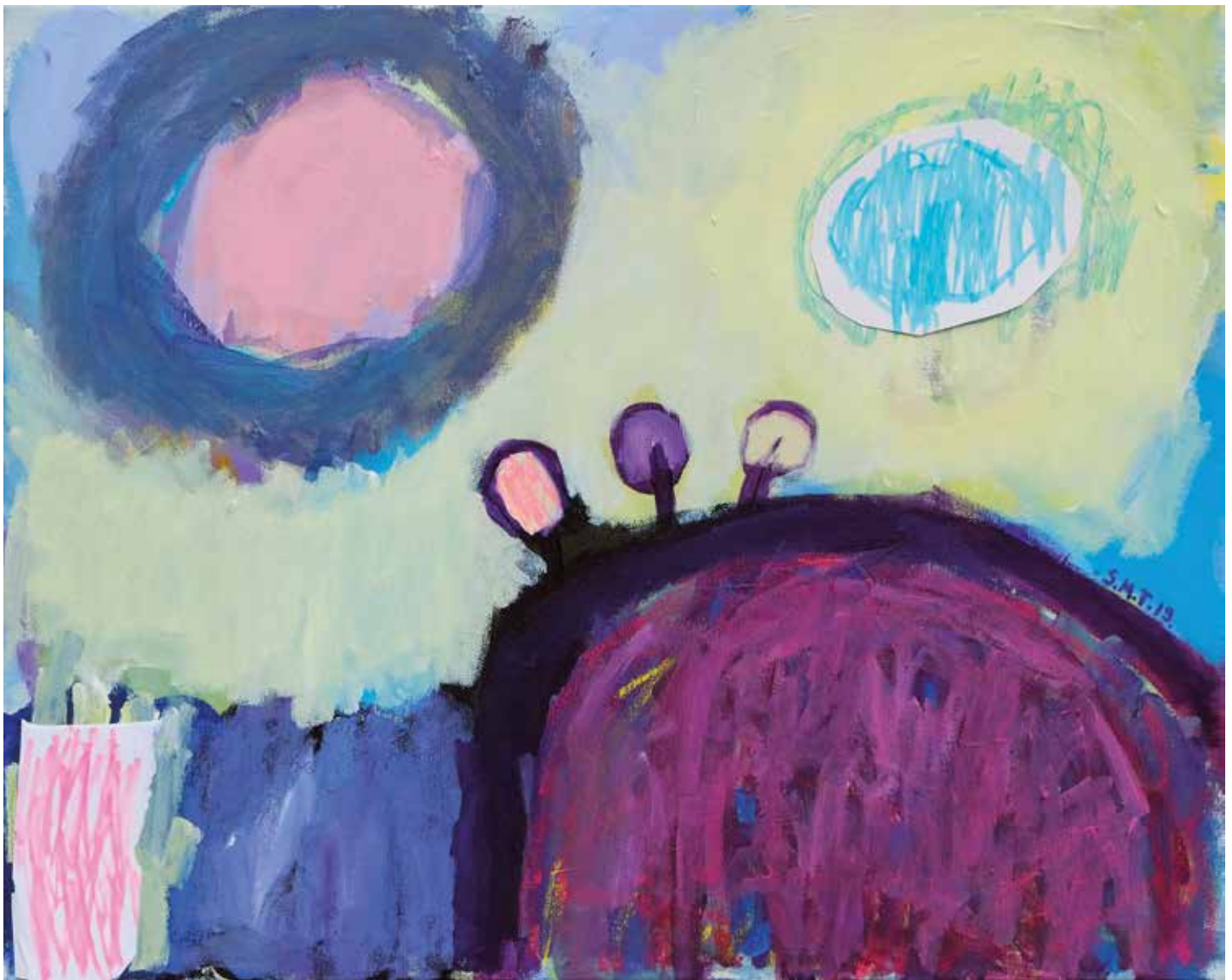
19. Rožnata livada, 2019, mešana tehnika na platnu, 40 x 50 cm