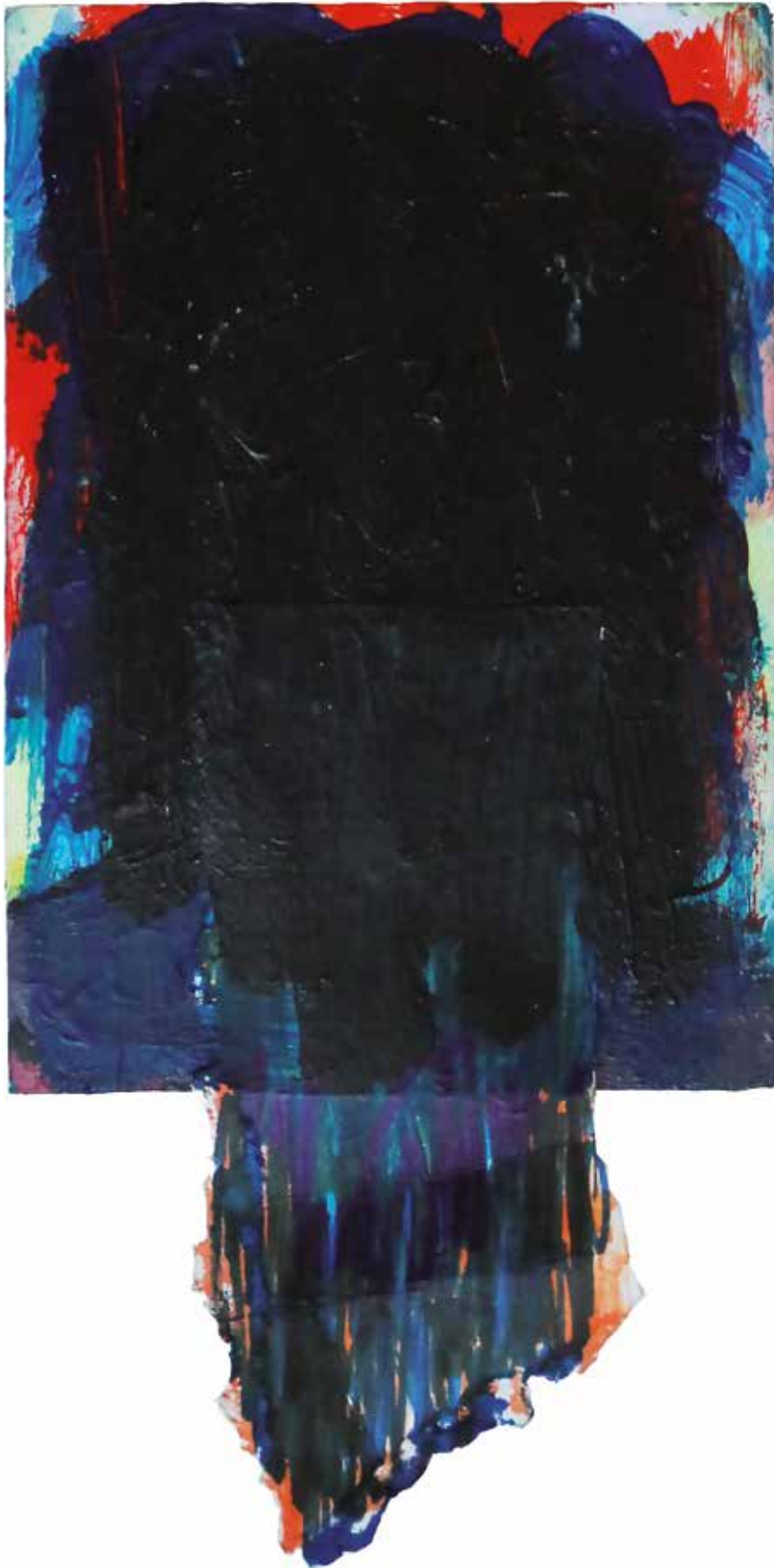
16. Noćni dež, 2019, mešana tehnika na lesu, 15 x 10 cm