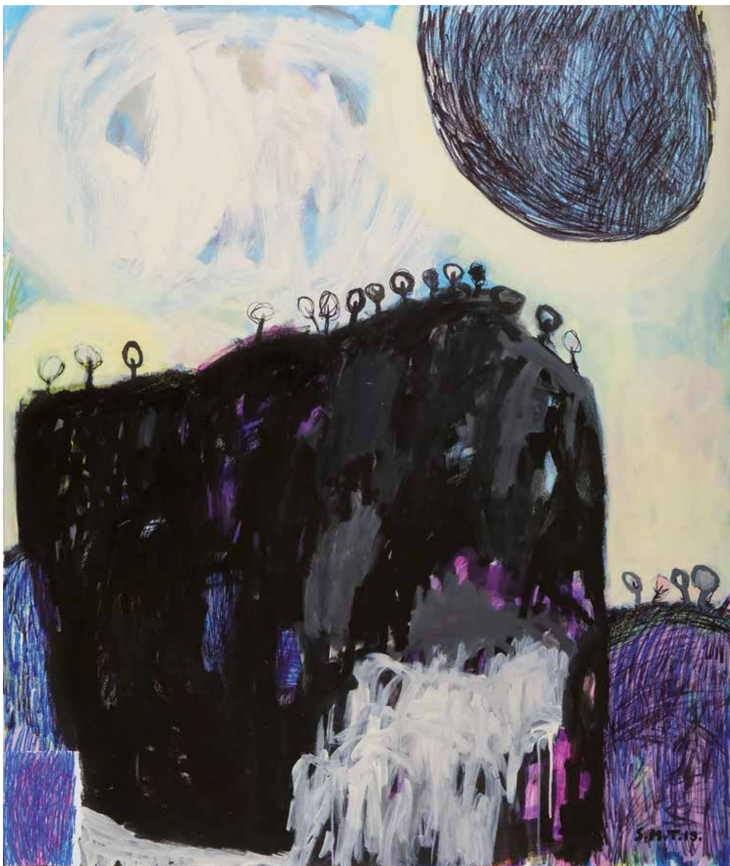
17. Neobiskani snegovi, 2019, mešana tehnika na platnu, 120 x 100 cm