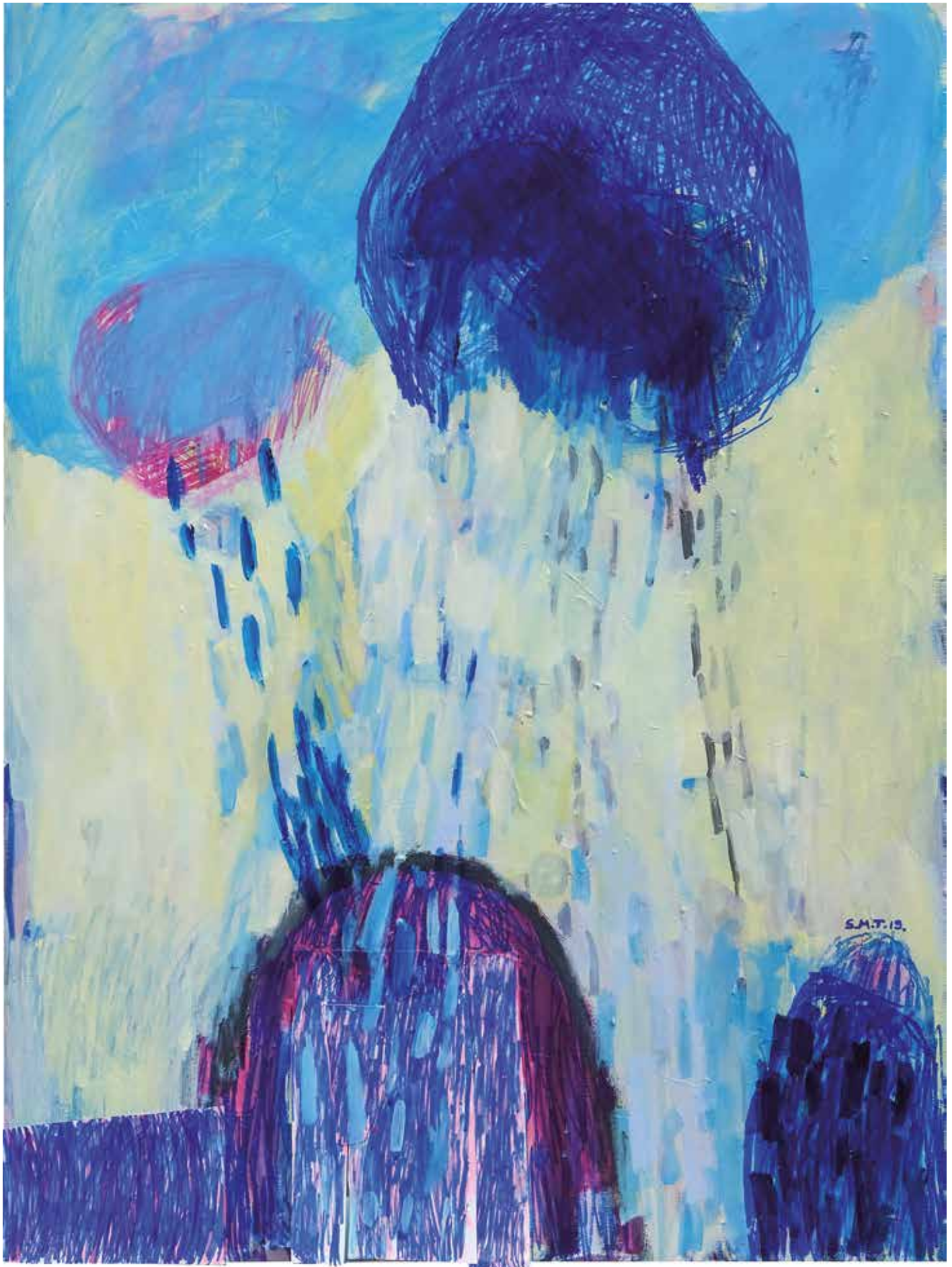
11. Dežuje, 2019, mešana tehnika na platnu, 80 x 60 cm