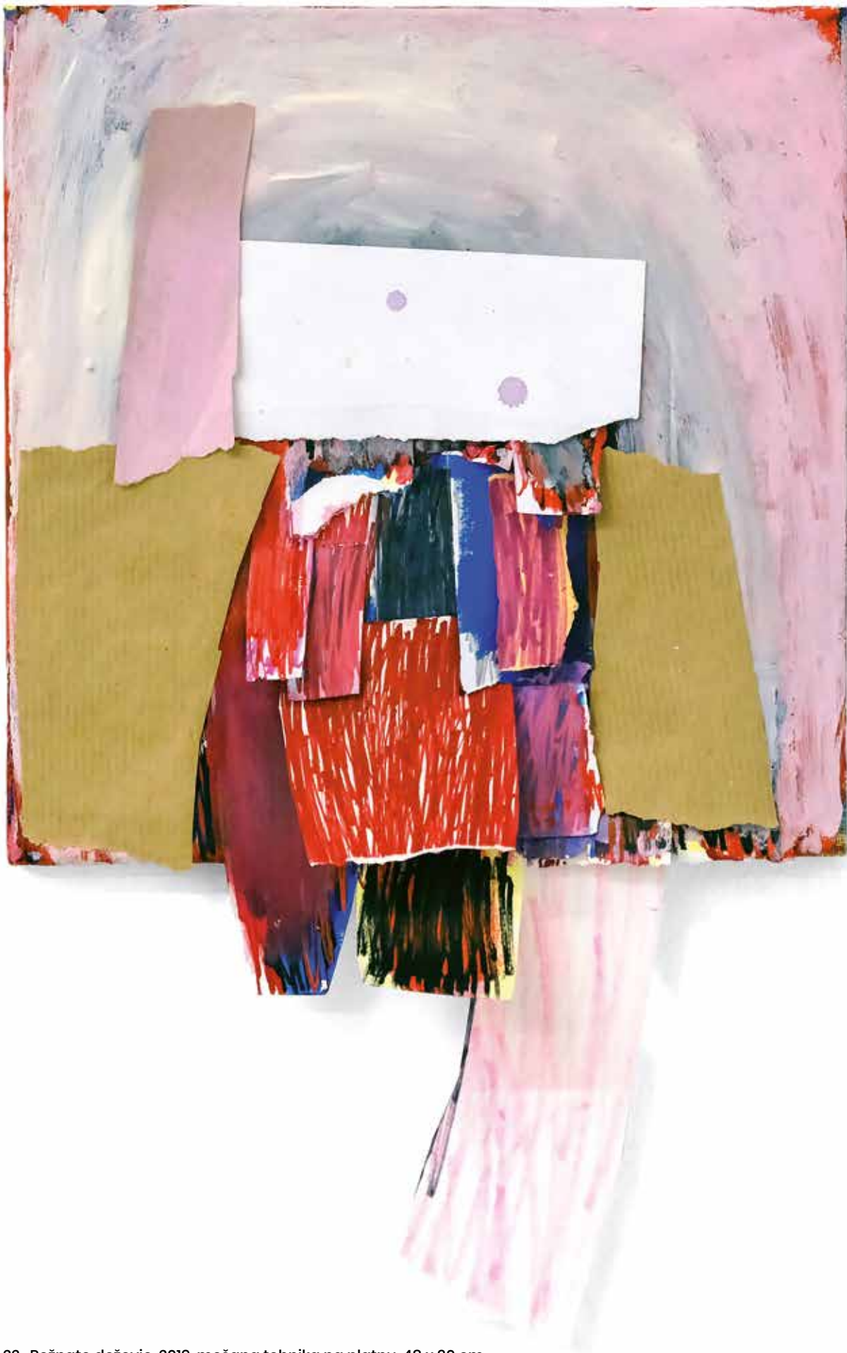
22. Rožnato deževje, 2019, mešana tehnika na platnu, 48 x 30 cm