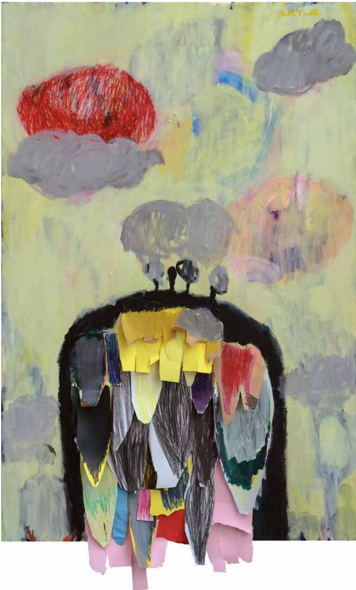
10. Igra in sonce (Rdeči oblak), 2018, mešana tehnika na platnu, 130 x 80 cm