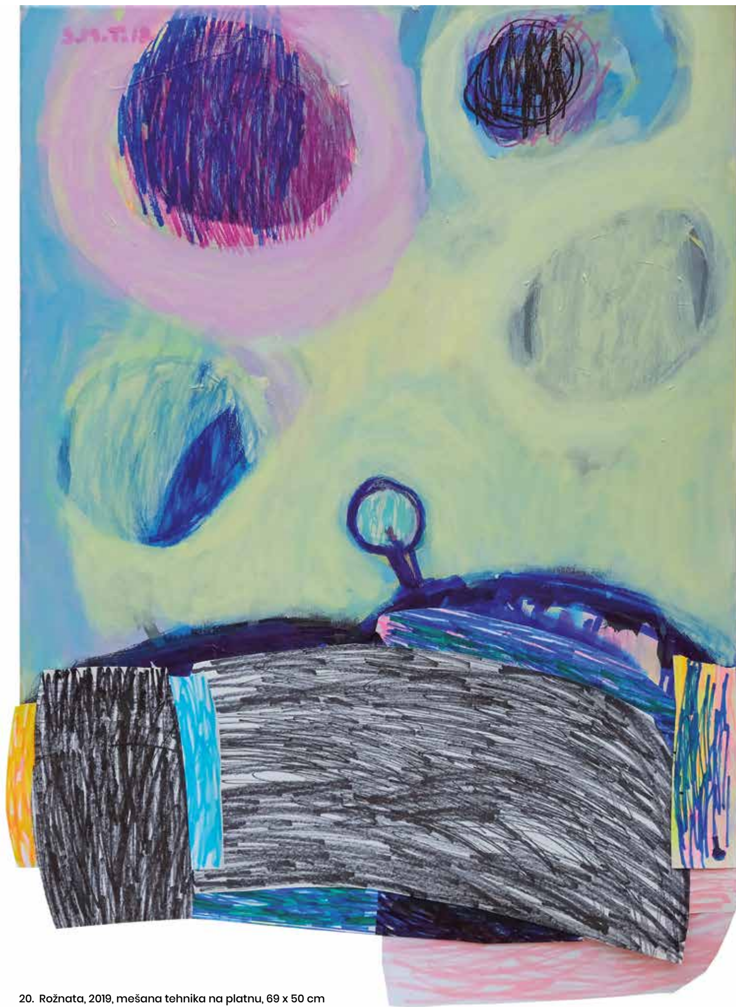
20. Rožnata, 2019, mešana tehnika na platnu, 69 x 50 cm