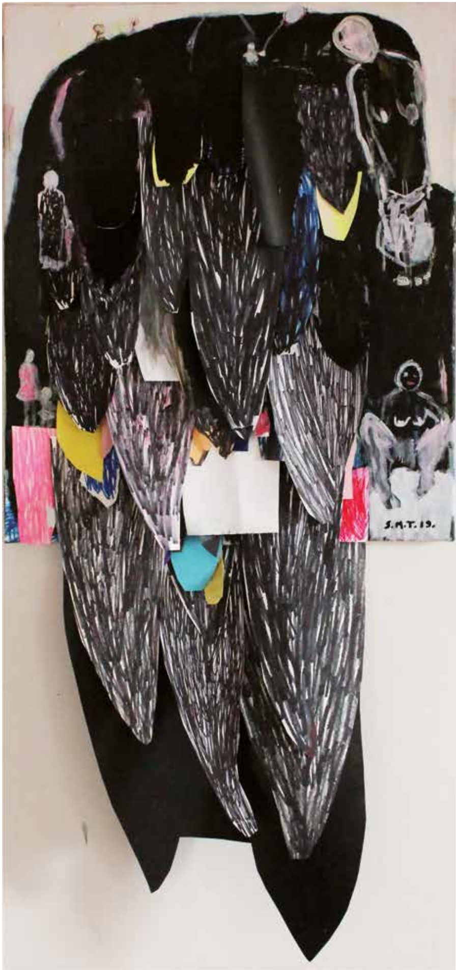
12. Hommage v črnem in rožnatem, 2019, mešana tehnika na platnu, 100 x 50 cm