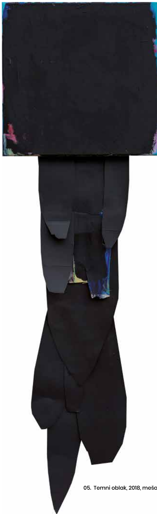
05. Temni oblak, 2018, mešana tehnika na platnu, 102 x 30 cm