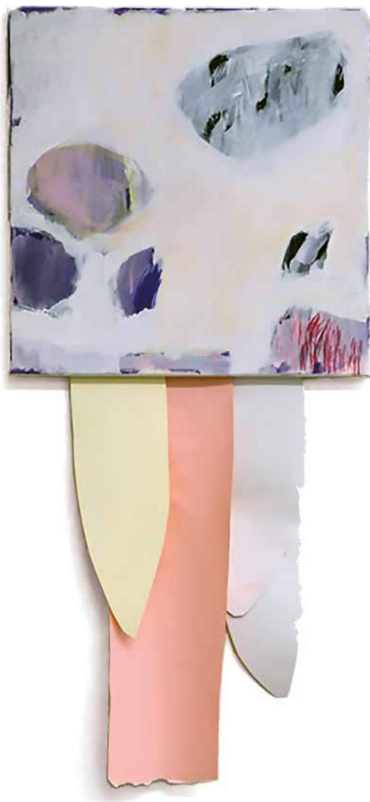
14. Oblaki in rožnata, 2019, mešana tehnika na platnu, 86 x 40 cm