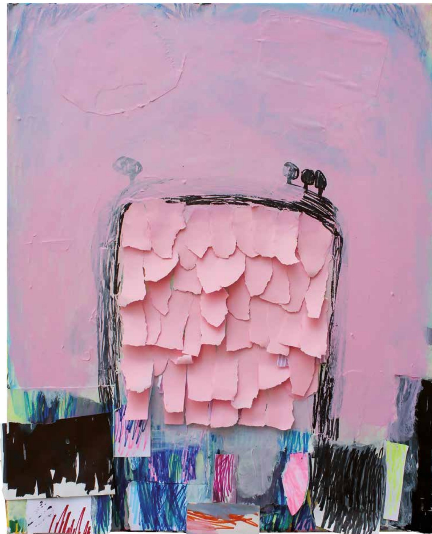
26. Rožnati listi, 2020, mešana tehnika na platnu, 60 x 50 cm