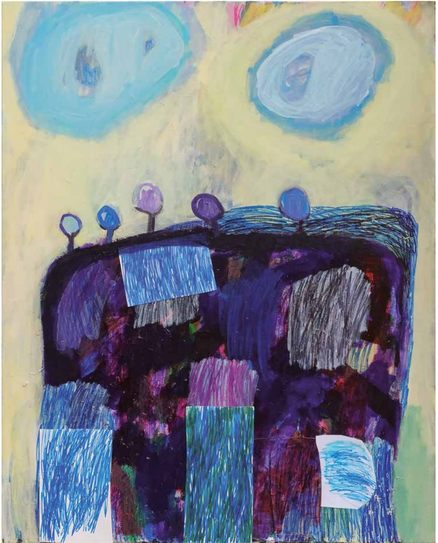
15. Na robu gozda, 2019, mešana tehnika na platnu, 100 x 80 cm